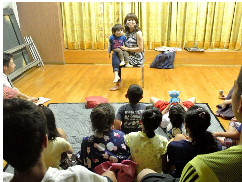
腹話術による怪談読み聞かせ授業