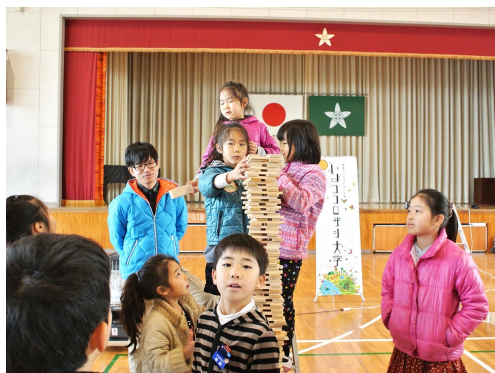
かまぼこ板重ねギネス挑戦