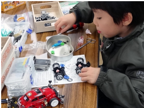
ミニ四駆製作授業