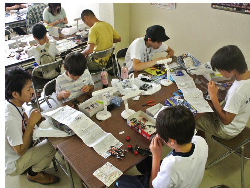
プラモデル製作授業