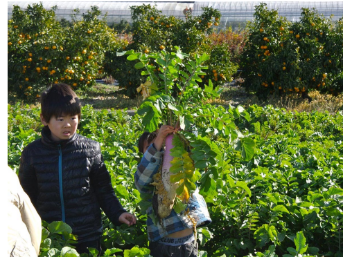
北条伝統野菜授業