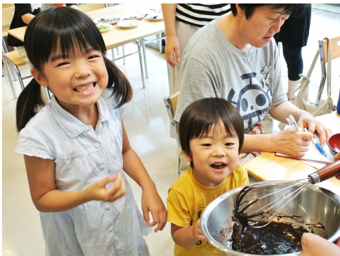
にぼしおかわり授業