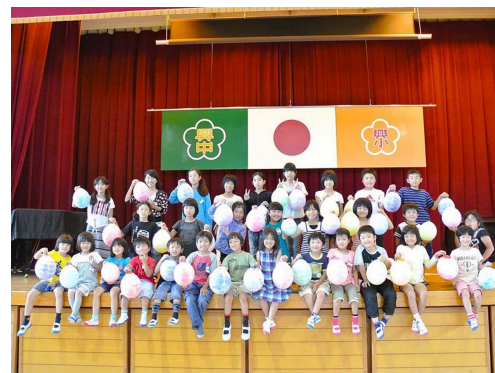
十七夜ちょうちん製作授業