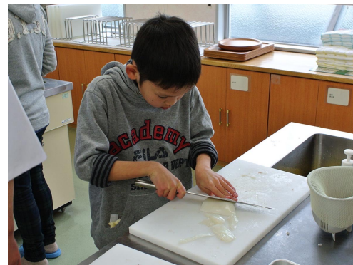
魚のさばき方授業