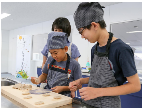
じゃこ天(八幡浜市)