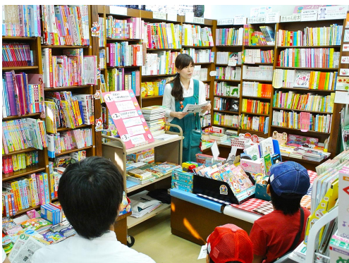
夏休み課題図書克服授業