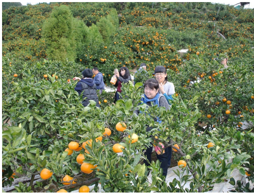
温州みかん(八幡浜市)