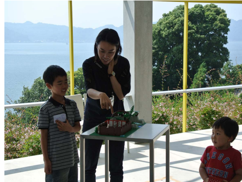
レゴで想像建築授業