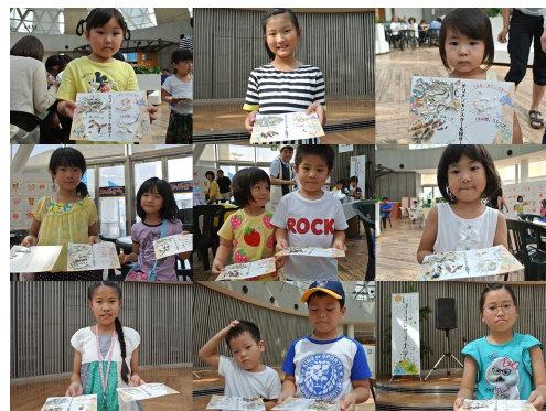
チリメンモンスター