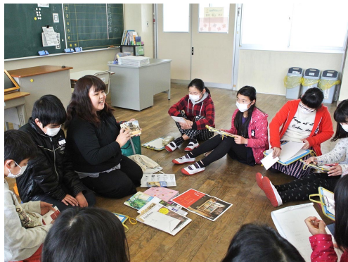
ようこそ先輩授業