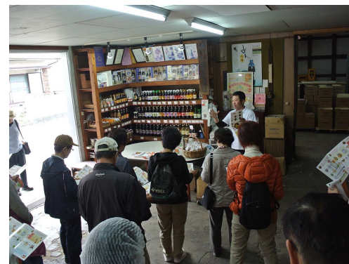
醤油・味噌(松山市)