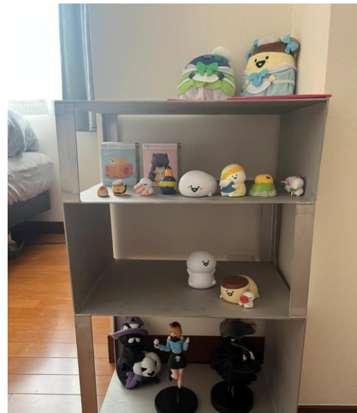
ディスプレイラック