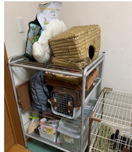
うさぎ用品ラック